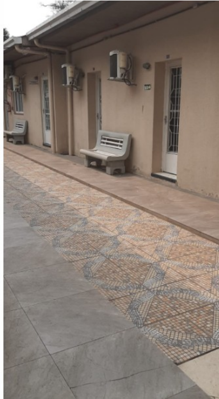
Figura 01: Área dos gabinetes dos vereadores (problemas de acessibilidade)

CÂMARA MUNICIPAL DE URUGUAIANA PALÁCIO BORGES DE MEDEIROS