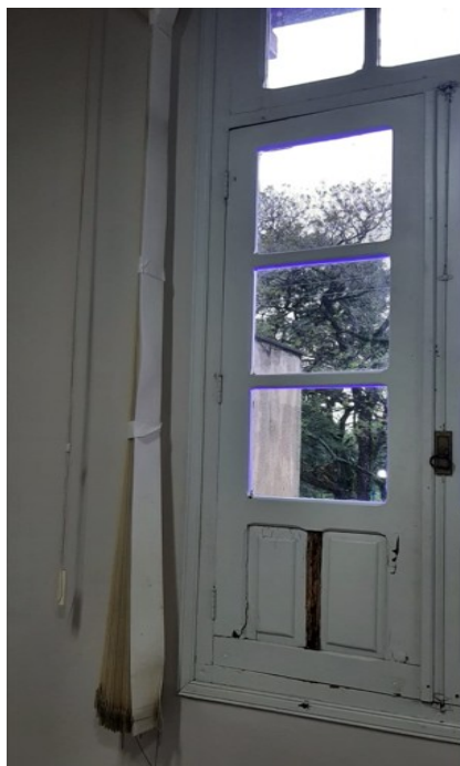
Figura 05: Janela da Fachada da CMU (exemplificativa)

Esses problemas afetam a conservação do patrimônio, além de dificultar o correto fechamento e vedação das portas e janelas, expondo o prédio a fatores externos como umidade e vento. A falta de manutenção adequada pode agravar a situação, tornando necessária uma intervenção mais abrangente e onerosa no futuro. Além das aberturas de madeira, algumas portas de metal também apresentam necessidade de manutenção. A restauração dessas estruturas é fundamental para garantir sua durabilidade, preservar o valor histórico da edificação e manter o conforto e segurança dos usuários do prédio.