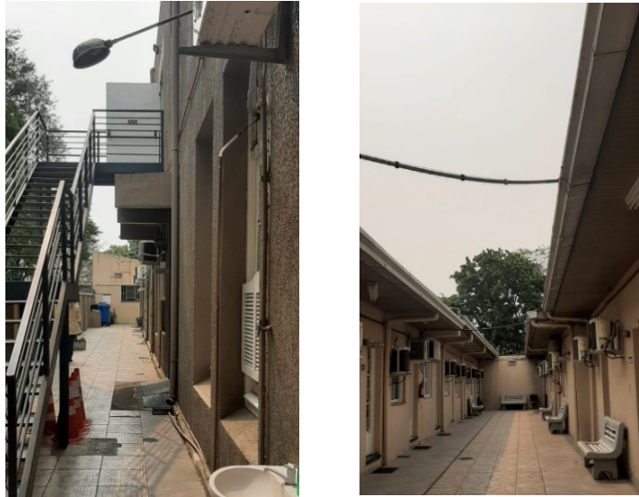
Figura 03: Pátio/corredor aberto de acesso aos gabinetes dos vereadores

CÂMARA MUNICIPAL DE URUGUAIANA PALÁCIO BORGES DE MEDEIROS