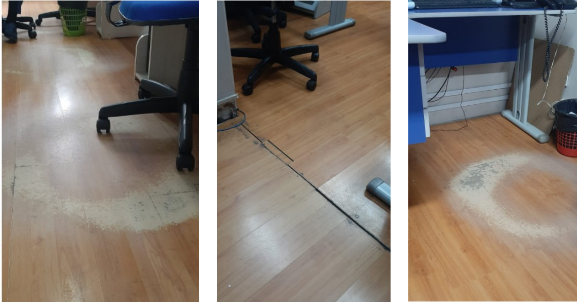
Figura 02: Desgaste do piso laminado dos departamentos