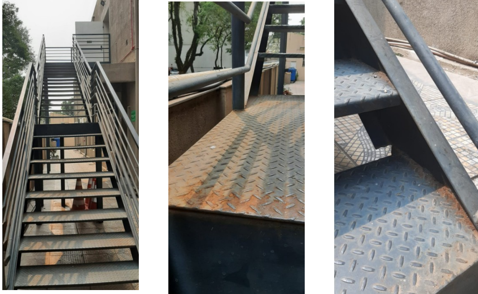
Figura 04: Escada de emergência com sinais de ferrugem

CÂMARA MUNICIPAL DE URUGUAIANA PALÁCIO BORGES DE MEDEIROS